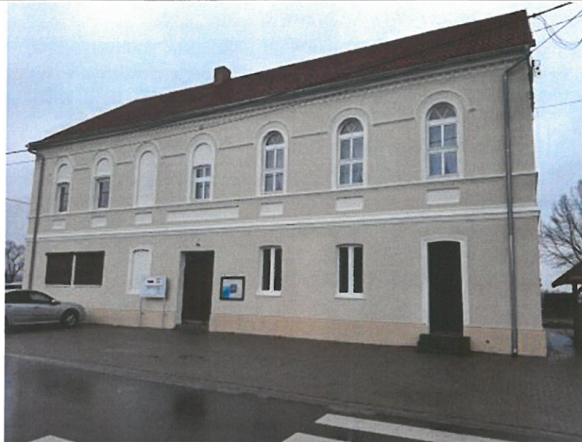
Budynek świetlicy w Miechowie