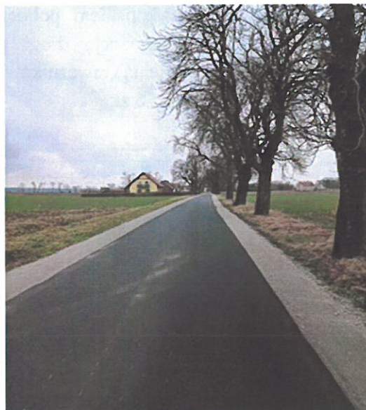
Zmodernizowane drogi w miejscowości Domasłów