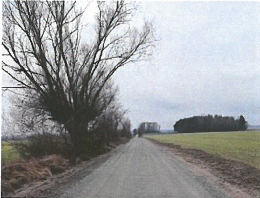
Droga w Kozie Wielkiej

W ramach zadania wykonano przebudowę drogi dojazdowej do pól (droga gruntowa w kierunku Lotosu) na odcinku 809 mb. Przebudowa objęła wykonanie korytowania, profilowania i ułożenia dolnej (0/63 gr. 15 cm) i górnej (0/31,5 gr. 8 cm) warstwy mieszanki granitowej wraz z wykonaniem poboczy gruntowych. W ramach powyższego zadania wykonano także modernizację drogi gminnej G866532 poprzez wykonanie nakładki bitumicznej wraz z wymianą krawężników oraz wykonaniem pobocza z tłucznia. Wartość robót dla obu dróg to 830.395,56 zł.