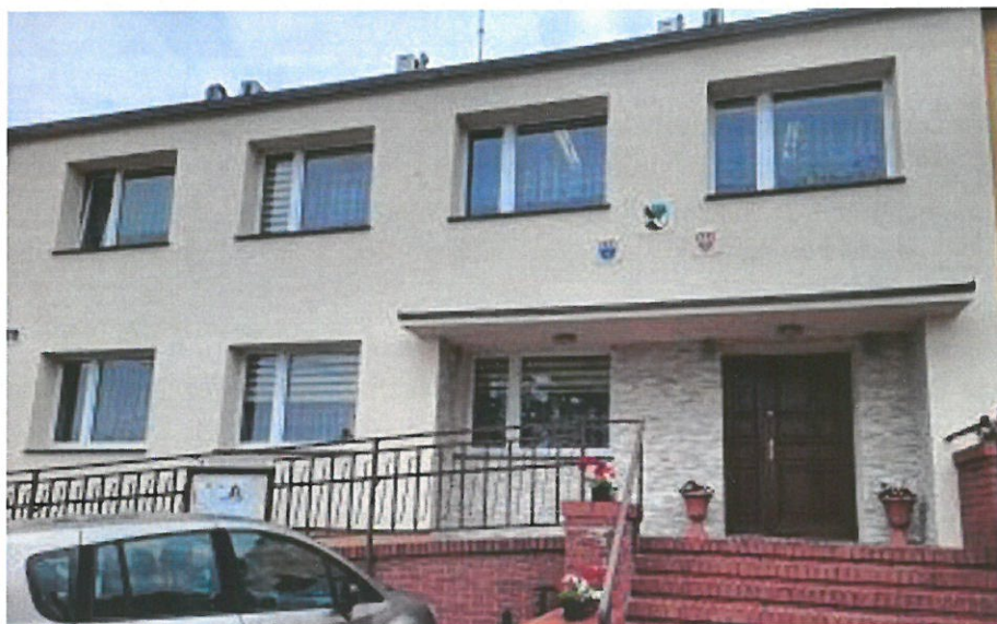
Budynek Urzędu Gminy w Perzowie

W ramach zadania dokonano remontu pomieszczeń higieniczno – sanitarnych oraz pomieszczenia kuchennego. Przeprowadzono także remont elewacji budynku. Łączne nakłady wyniosły 228.277,12 zł.