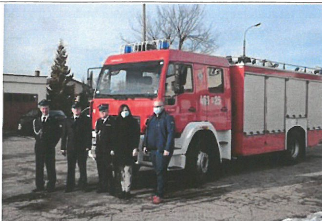
Nowy pojazd bojowy dla OSP Perzów