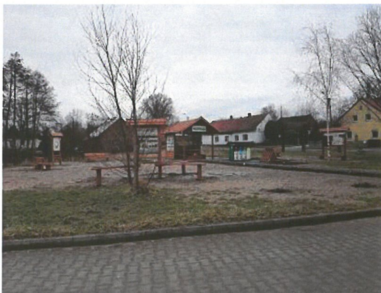
Ścieżka edukacyjna – Ptasie Radio w Sołectwie Słupia pod Bralinem

W ramach zadania utworzono ścieżkę edukacyjną mającą na celu przywrócenie do użytku terenów zielonych oraz szerzenie wiedzy na temat gatunków ptaków i miejsc ich bytowania. Do końca roku 2021 zakończono zaplanowane zadanie, ponosząc nakłady na jego realizację w kwocie 67.285,59 zł, w tym dotacja z WFOŚiGW w Poznaniu.