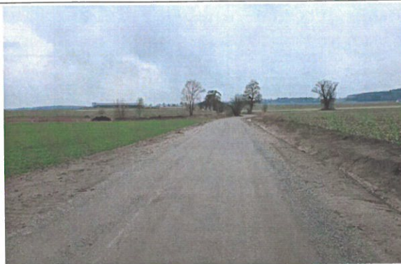
Droga w miejscowości Turkowy