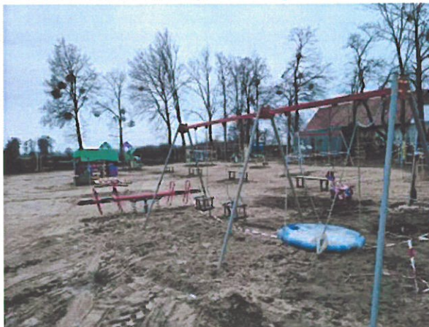
Plac zabaw w Trębaczowie

W ramach zadania zakupiono i zamontowano nowe urządzenia zabawowe oraz elementy siłowni zewnętrznej przy Zespole Szkół w Trębaczowie. Wartość zadania 109.593,00 zł. Zadanie dofinansowane w konkursie Pięknieje Wielkopolska Wieś kwotą 50.000,00 zł.