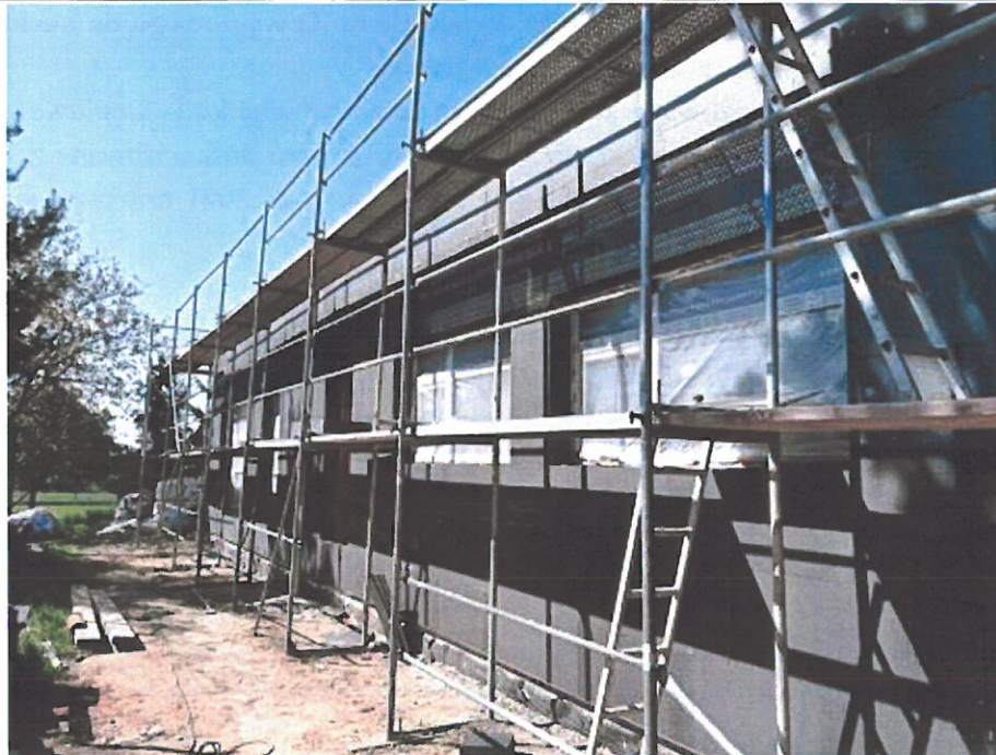
Budowa przedszkola w Trębaczowie