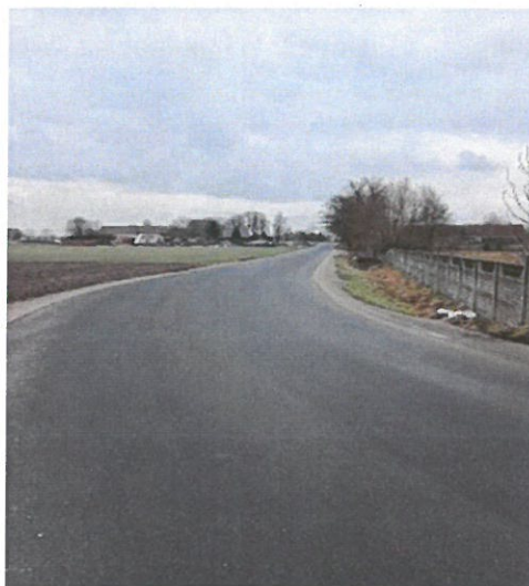
Droga w Miechowie

W ramach zadania wykonano modernizację nakładki bitumicznej na odcinku 355 m wraz z poboczami z kamienia łamanego. Wartość inwestycji to 195.897,86 zł.