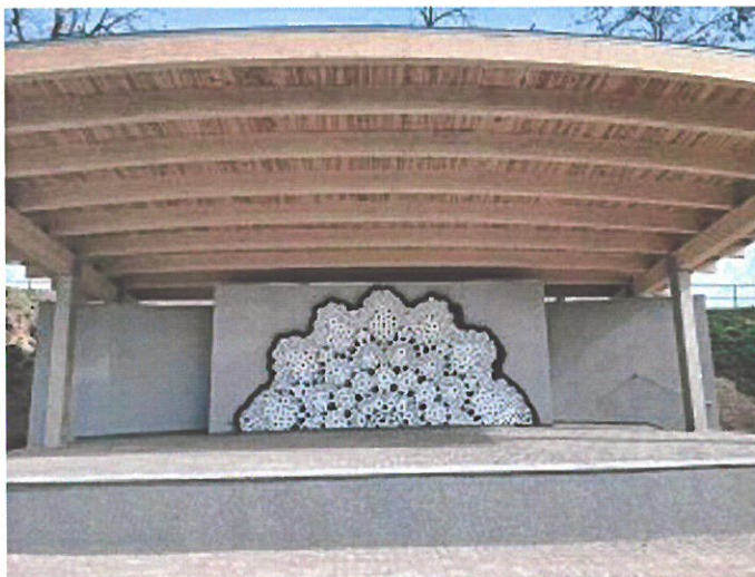
Scena plenerowa w Perzowie

Zadanie polegało na rozebraniu starej konstrukcji sceny oraz wzniesieniu nowej, zadaszonej, na której odbywać się będzie większość imprez organizowanych w ramach działań promocyjnych i kulturalnych Gminy, szkół i innych organizacji. Poniesione wydatki w roku 2021 to kwota 294.655,77 zł.