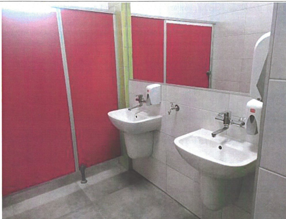
Nowe łazienki w szkole w Perzowie