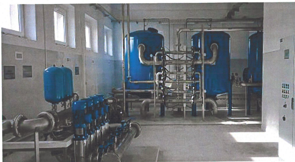
Stacja Uzdatniania Wody w Perzowie

W roku 2020 wprowadzono do budżetu gminy nowe zadanie inwestycyjne pn. „Budowa i przebudowa stacji uzdatniania wody w Perzowie”, do realizacji na lata 2020-2021. Zadanie powyższe zostało również wprowadzone do WPF Gminy Perzów na lata 2020-2039. Pod koniec roku 2020 przeprowadzono postępowanie o zamówienie publiczne w celu wyłonienia wykonawcy inwestycji, wykonawca zadania został wyłoniony. Nakłady planowane do poniesienia w roku 2020 to kwota 50.000,00 zł, a do końca roku nie poniesiono wydatków. W roku 2021 dokonano przebudowy SUW Perzów za kwotę 1.110.569,46 zł. Zadanie zostało częściowo sfinansowane z Rządowego Funduszu Inwestycji Lokalnych.