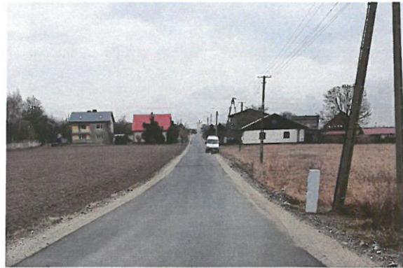
Droga w Słupie pod Bralinem