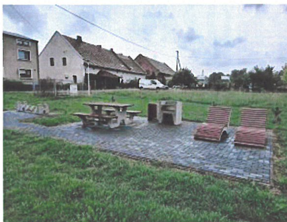
Zagospodarowany teren przy stawie w Domasłowie

W ramach zadania wykonano miejsce do grillowania, chodnik oraz leżaki do wypoczynku. Koszt zadania to kwota 24.464,70 zł.