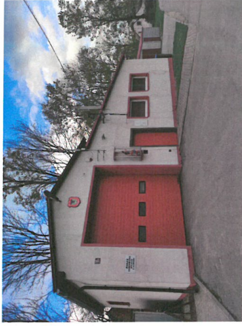
Ochotnicza Straż Pożarna